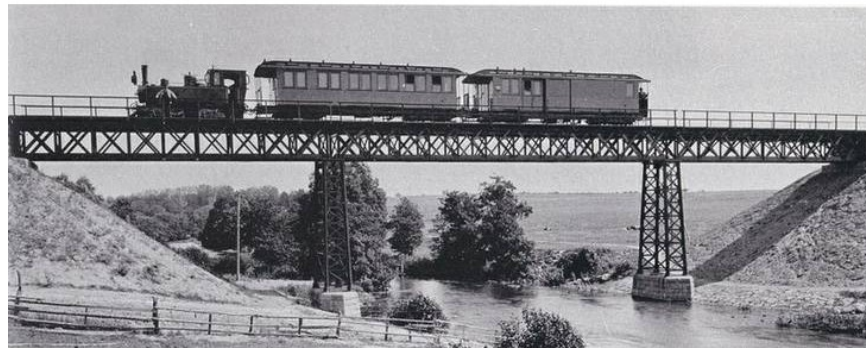
Jernbanebroen ved Gammelstrup omkring år 1900. (Arkivfoto)

Brædstrup Turistforening har kæmpet en sej kamp for at storebror Horsens efter kommunesammenlægningen skulle få øjnene op for de kultur- og naturmæssige kvaliteter Brædstrup området kunne byde på. Den Genfundne Bro blev en øjenåbner. Der var jo ingen grund til at udvide den lille parkeringsplads ved Broen, mente man i Horsens. Tiden har vist noget andet. Det er en af de største turistattraktioner i Horsens Kommune.